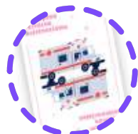
Leticia Ordás Prieto TES

Funciones del TES en un vehículo de intervención rápida (VIR)